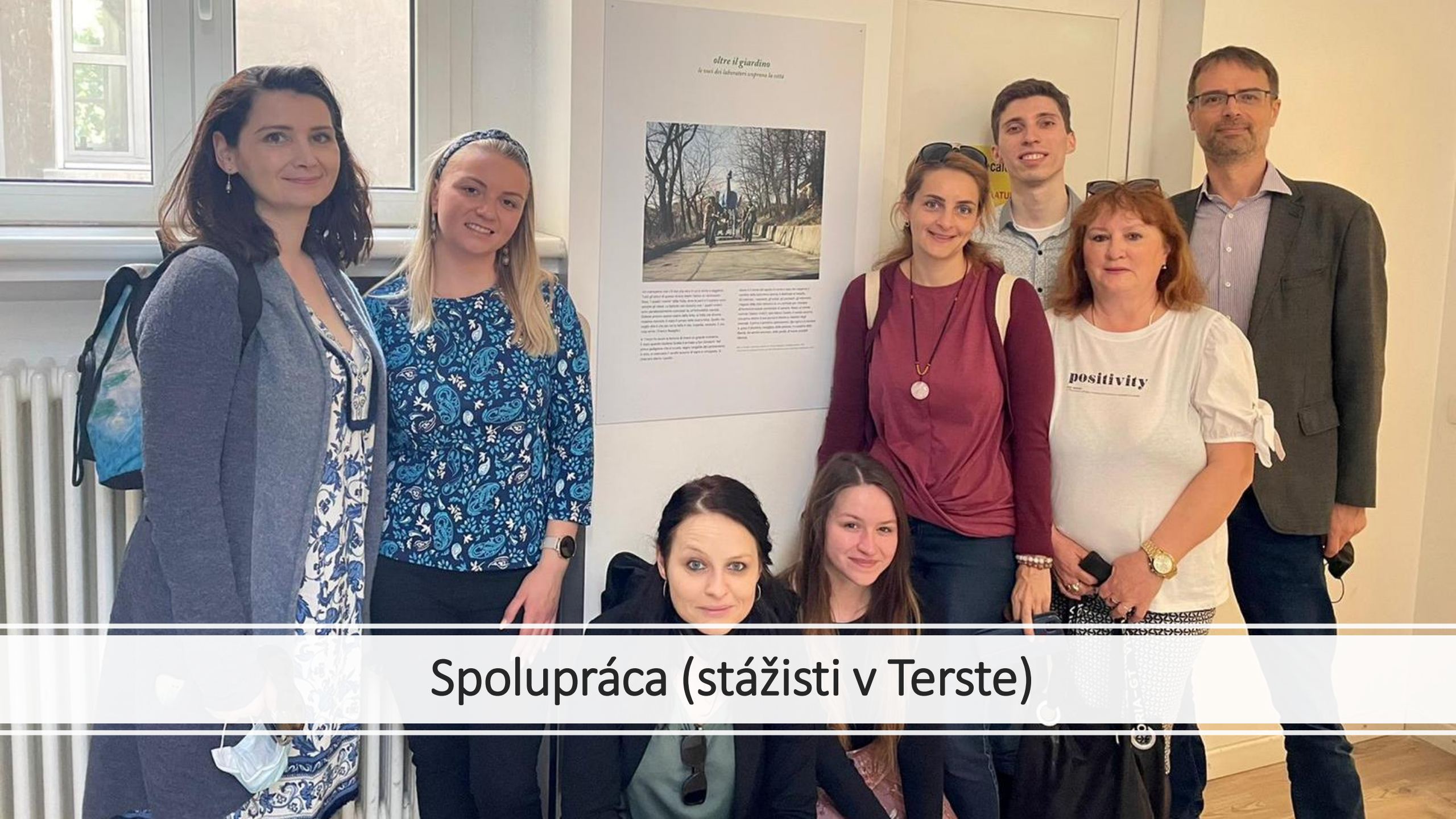
Spolupráca (stážisti v Terste)